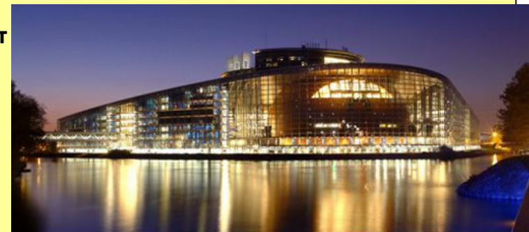
architectes: Architecture Studio Пленарната зала в Страсбург

Генералният секретариат обаче е разположен главно в Люксембург и отчасти в Брюксел (но не и в Страсбург!).