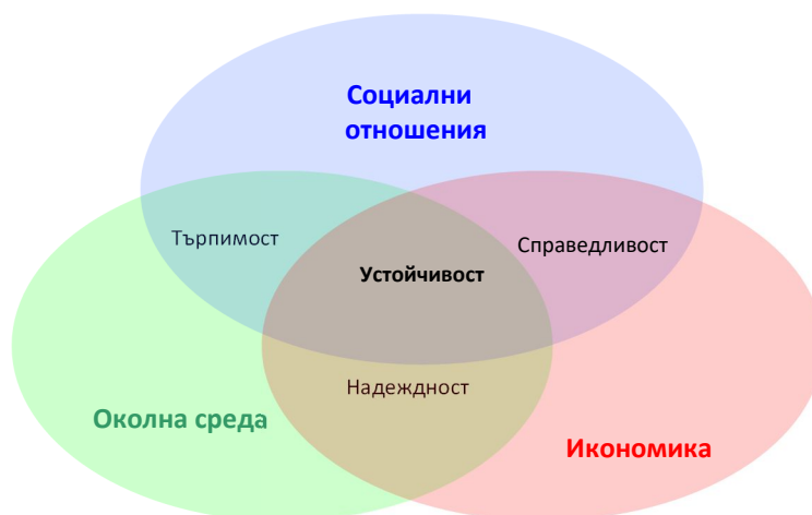
Фигура 3: Съвременно разбиране на концепцията за устойчиво развитие 1

Не може да се пренебрегне нито един от аспектите на устойчивостта. Ако обществото консумира повече, отколкото създава, ще натовари с непосилни плащания следващите поколения, т.е. обществото ще стане икономически неустойчиво. Има достатъчно примери за такова неустойчивост – като се започне от Зимбабве в другия край на планетата и се свърши с Гърция, която е до нас. Лош пример в това отношение дават и някои от икономически най-развитите страни, които консумират значително повече отколкото произвеждат. Япония, например, е натрупала държавен дълг почти два пъти и половина по-голям от брутният ѝ вътрешен продукт, а световният икономически лидер САЩ имат държавен дълг надхвърлящ общия доход на страната за цяла година. Натрупаните задължения, при една по-висока лихва, каквато се очаква скоро да има, ще породят огромни затруднения пред бюджетите не само на развиващите се, но и на най-развитите икономики.