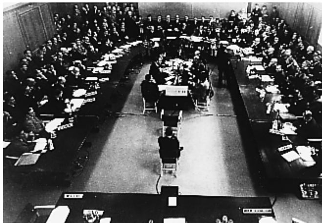
Church House (Лондон 1946)

Първите многостранни тарифни преговори започват през 1946 г. в Женева. Паралелно в Лондон се учредява Подготвителен комитет за създаването на Международна търговска организация (на снимката по-долу)