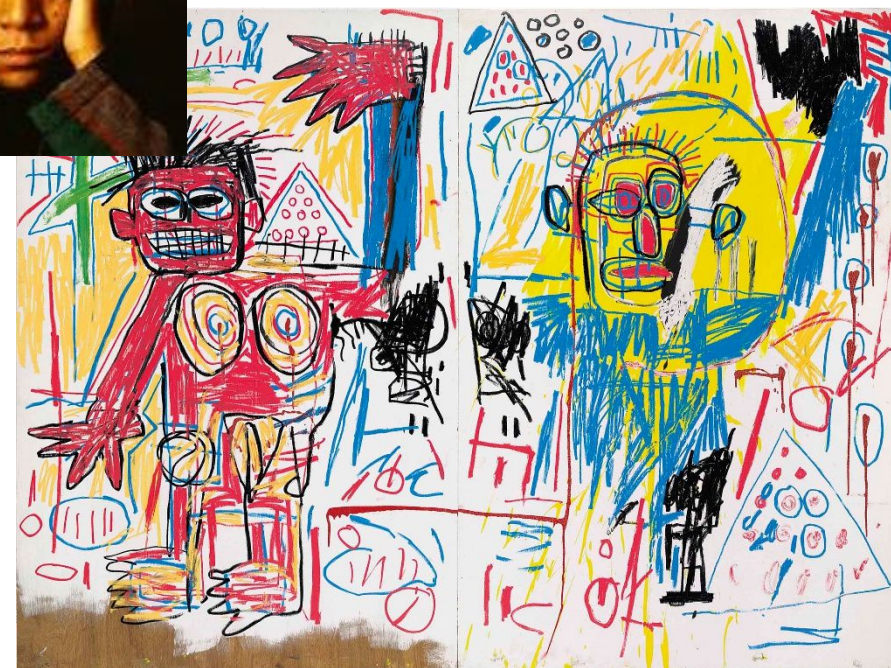
Жан-Мишел Баския 1960 - 1988 (Ню Йорк)