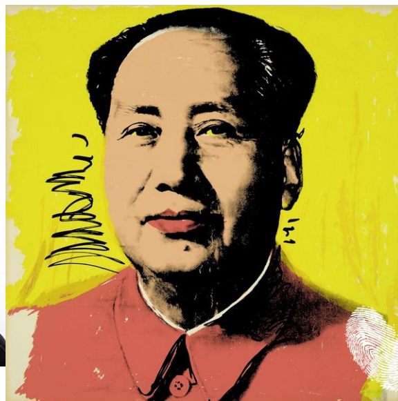
Енди Уорхол 1928 – 1987 (Ню Йорк)