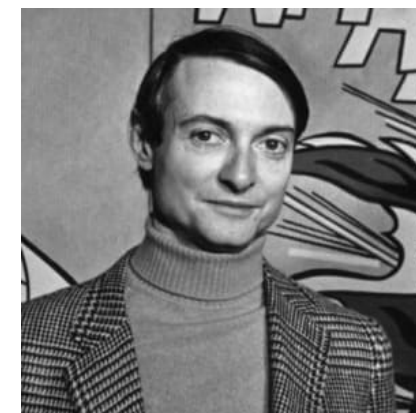
Рой Ликтенстайн 1923 – 1997, Ню Йорк