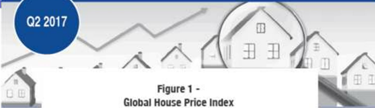
Figure 1 - Global House Price Index