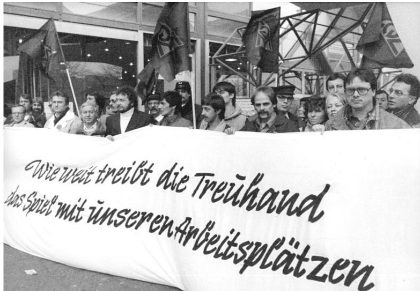
Митинг на металурзи пред централата на Тройханд. На плаката пише „Докъде може да стигне играта на Тройханд с нашите работни места?“

Западна Германия не бързат да се местят в новите провинции поради по-ниските доходи там...“