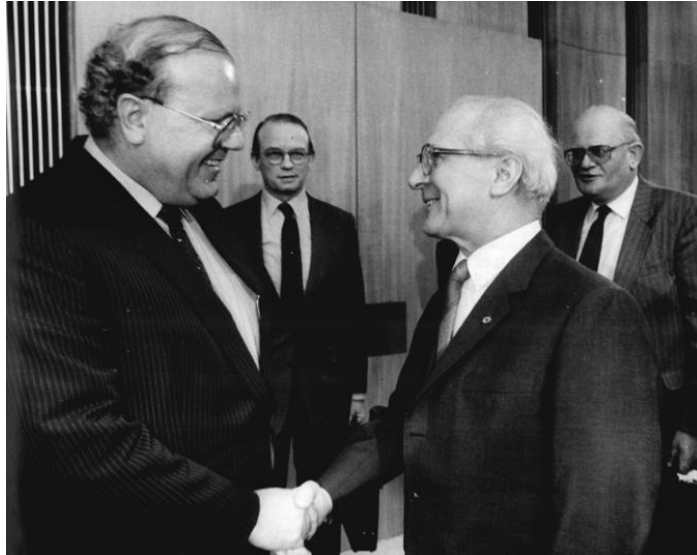
Бангеман при Хонекер през 1986 г. в Източен Берлин. Подготвят посещението на Хонекер в Бон и смесените предприятия, за които ще стане дума по-нататък

„Сегашните срещи и разговори...имаха не само чисто икономически характер, а доведоха до някои принципно нови резултати. Договореността за провеждането на такива разговори бе постигната по време на пребиваването на председателя на Държавния съвет Тодор Живков във ФРГ. Следователно всичко, което набелязахме сега във Варна, може да се смята като непосредствен резултат от това посещение, което премина при голям успех и бе топло приветствано както от обществеността на Федералната република, така и от правителството...