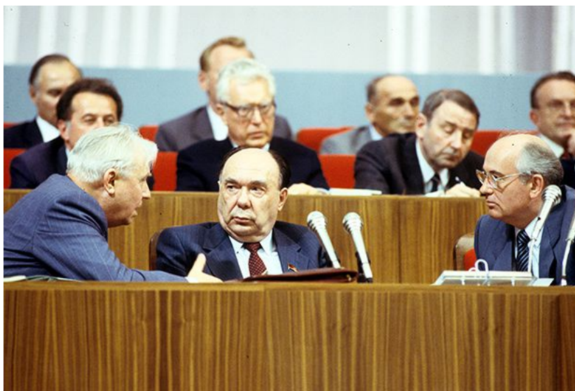
На снимката: Александър Яковлев между Михаил Горбачов (вдясно) и Егор Лигачов (вляво) по време на XIX конференция на КПСС (28 юни – 1 юли 1988 г.)