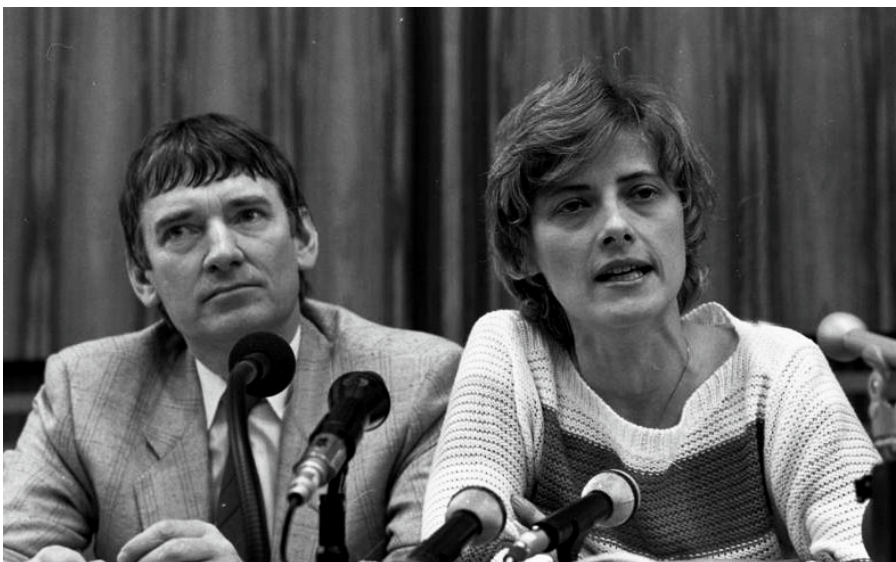
Шили и Кели на пресконференция на фракцията на Зелените в Бундестага

През 1983 г. Кели е вече депутат в Бундестага и то не редови депутат, а както се полага за основател на партия - един от двамата говорители (ръководители) на парламентарната фракция на Зелените, заедно с Ото Шили (Otto Schili) – на снимката по-долу. Но говорителите на Зелените доста се различават. Петра е безкомпромисна, пряма и силно емоционална (лични и на снимката), тя е определяна като водеща фундаменталистка, докато Ото е, ако използваме една друга много съдържателна немска дума, „kompromissbereit“, което ще рече „склонен на компромиси“, т.е. реалист, който смята че е „по-добре човек да има врабче в ръката, отколкото орел в небето“. Между двамата говорители на Зелените често прехвърчат искри, не само поради идеологически различия, но и защото и двамата са крайно амбициозни и желаят да оглавят партията.